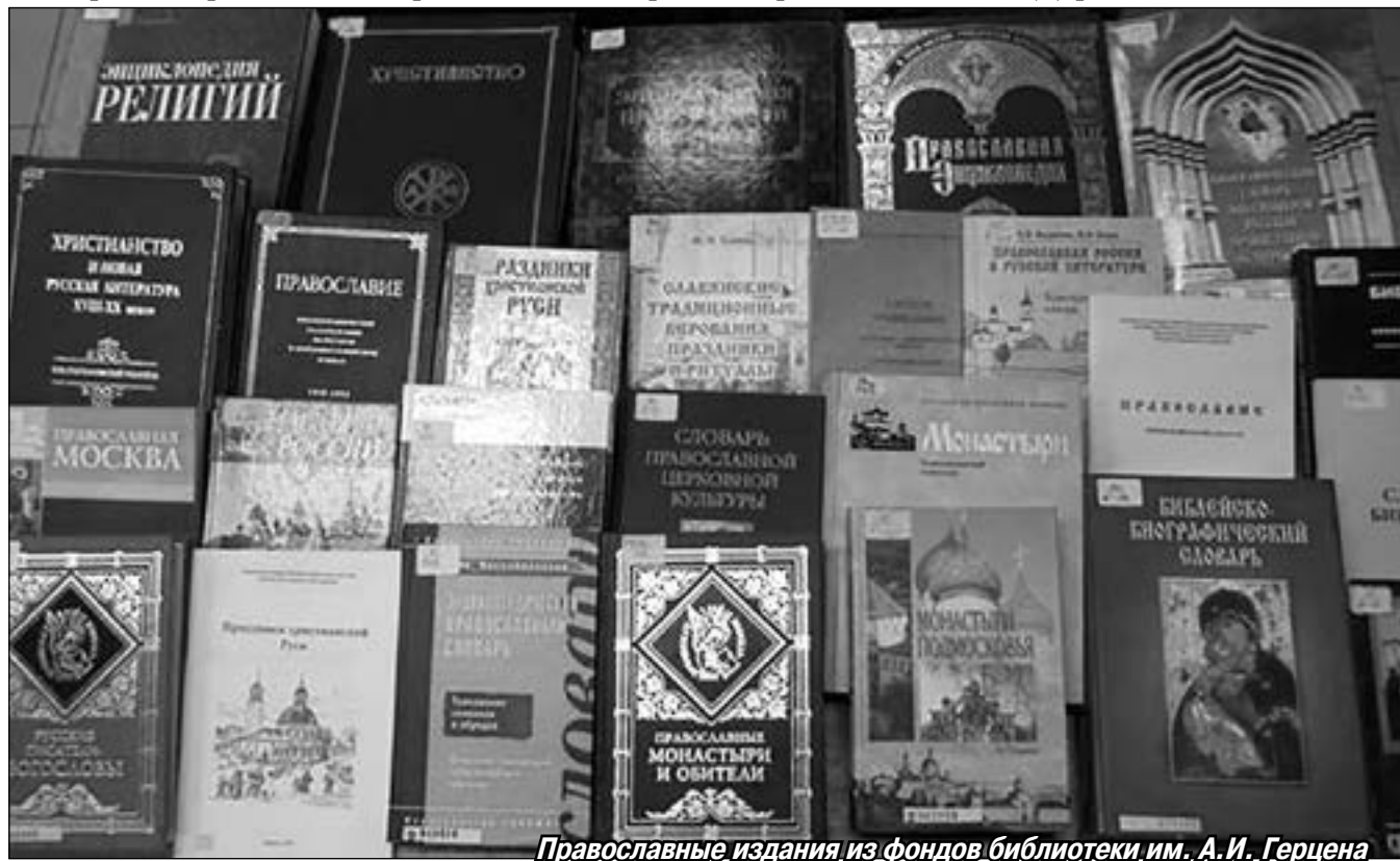
Православные издания из фондов библиотеки им. А.И. Герцена