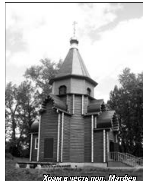
Храм в честь прп. Матфея