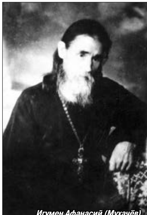
Игумен Афанасий (Мухачёв)