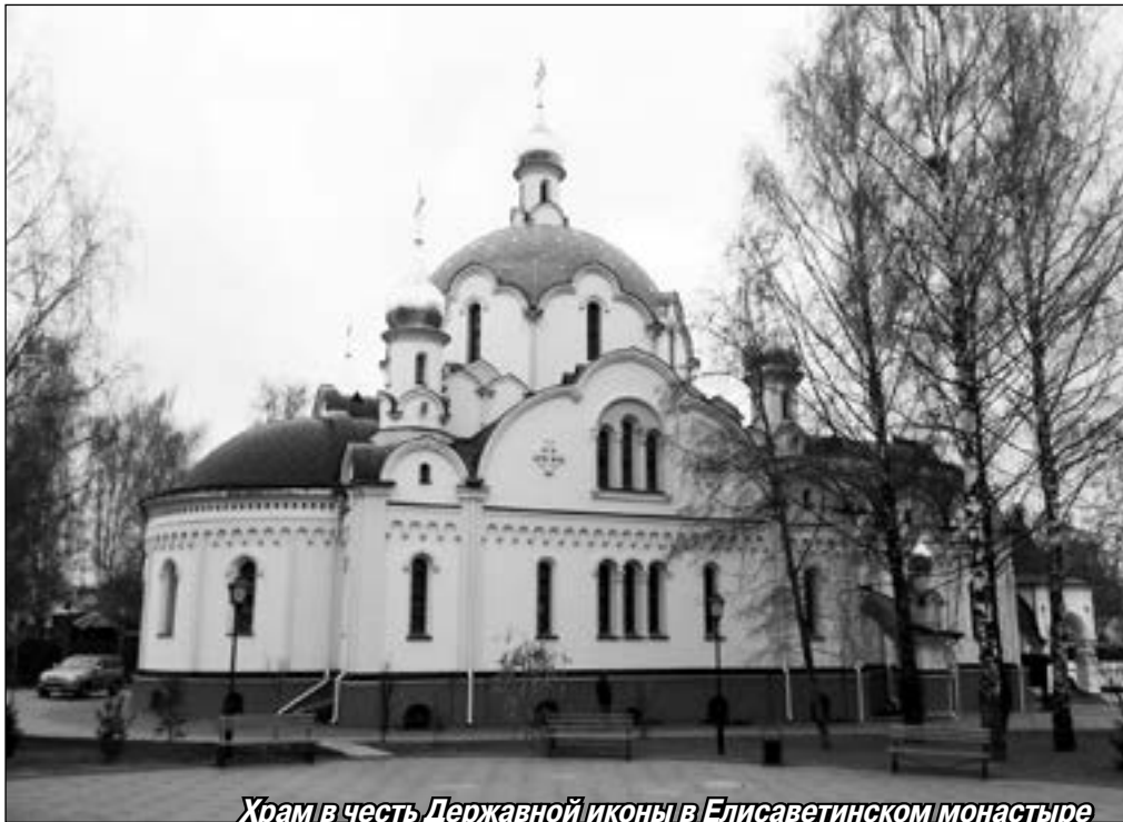
Храм в честь Державной иконы в Елисаветинском монастыре

Побывали мы в валяльных мастерских, которые открылись в обители три года назад и чьи изделия уже успели полюбить ценители