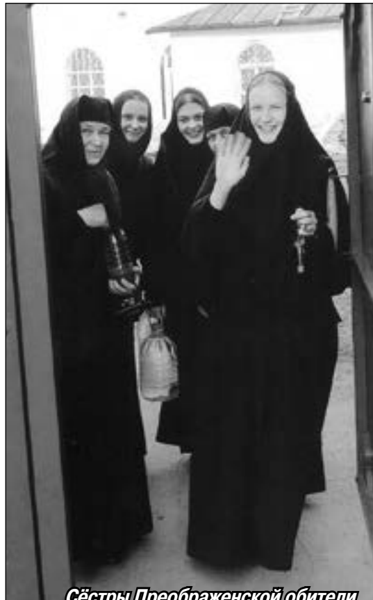
Сёстры Преображенской обители

— Насколько сегодня люди стремятся к духовной жизни?