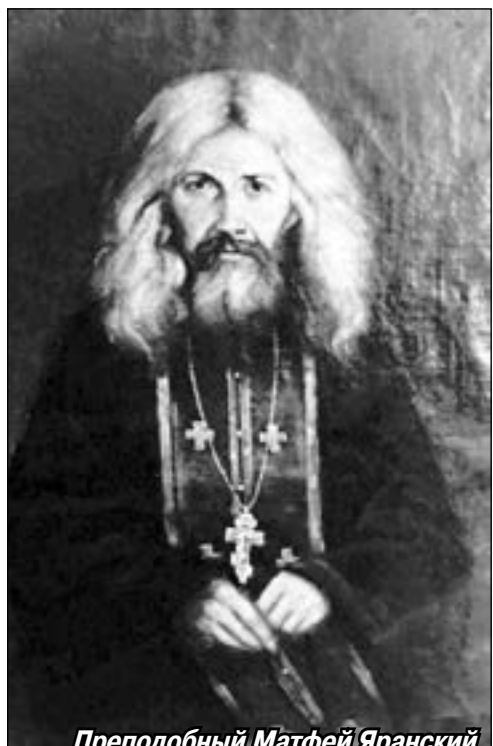
Преподобный Матфей Яранский

— Отец Нил, помнишь ли, я когда-то говорил тебе, что одна купеческая вдова из Яранска, умирая в 1895 году, завещала на устройство мужского монастыря около 115 тысяч десятин земли в