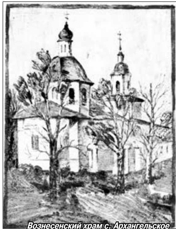
Вознесенский храм с. Архангельское