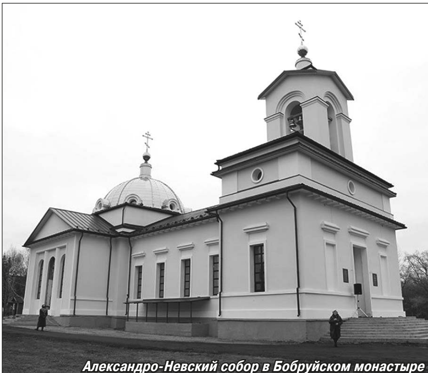
Александр-Невский собор в Бобруйском монастыре