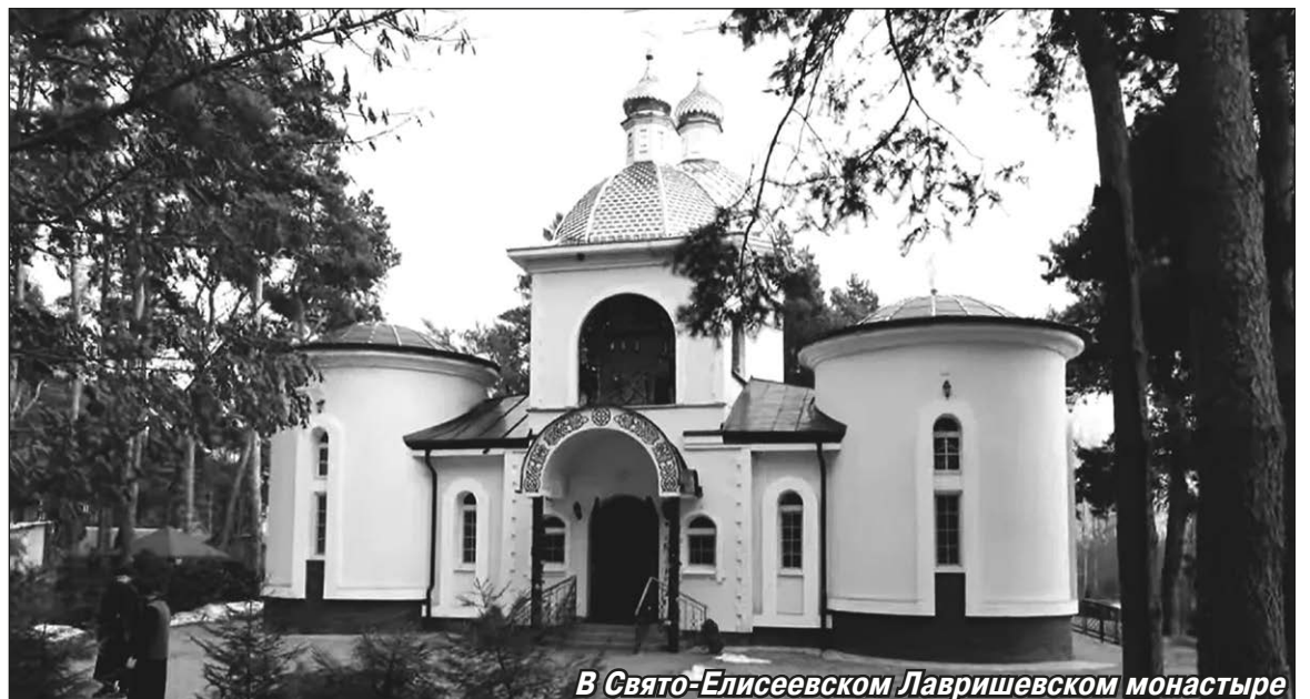
В Свято-Елисеевском Лавришевском монастыре