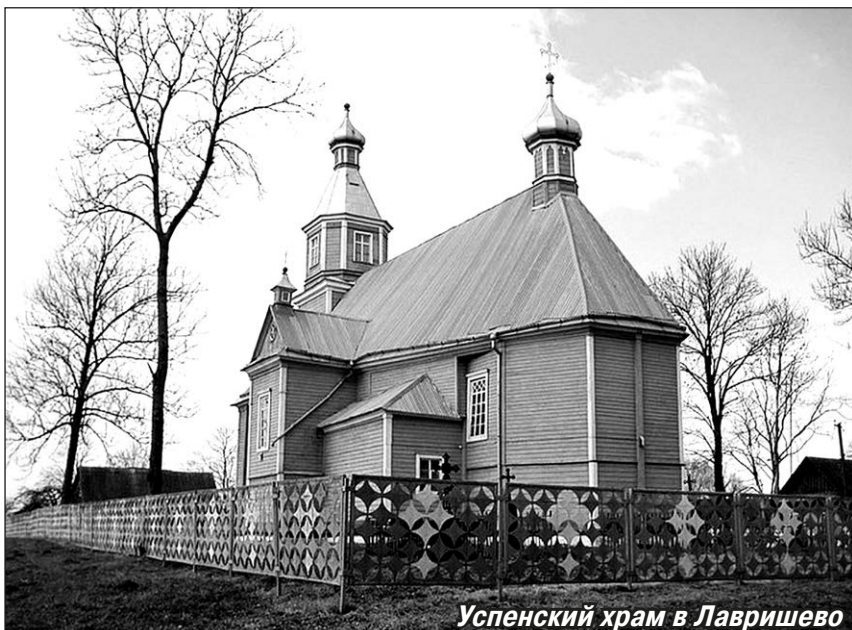
Успенский храм в Лавришево

Обитель являлась крупным центром летописания. Для неё было создано так называемое Лавришевское Евангелие, рукописный памятник книжной культуры XIII–XIV веков. Евангелие, которое сейчас хранится в Кракове, имеет особенное художественное оформление: оно иллюстрировано миниатюрами, его переплёт украшен драгоценными камнями и фигурной металлической пластиной. На территории монастыря во время его расцвета находились храмы Воскресения Христова и Рождества Пресвятой Богородицы, действовала