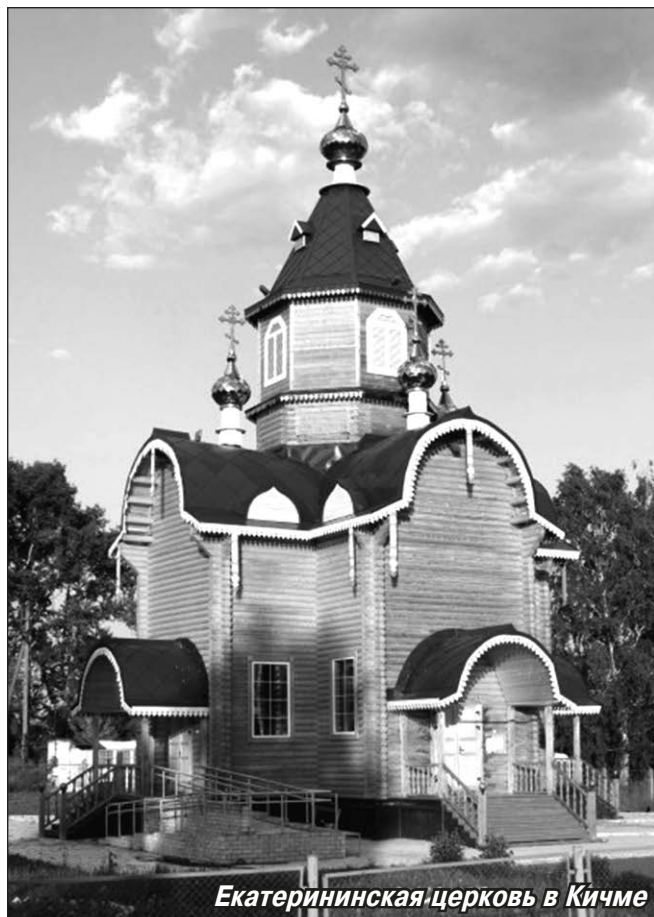
Екатерининская церковь в Кичме

просьбы, шли пожертвования от верующих горожан. Сейчас Омутнинск — вторая кафедра Уржумской епархии, а Троицкий храм стал кафедральным собором. Он располагается на живописном берегу пруда. Просторный, расписан внутри, в нём устроен многоярусный иконостас.