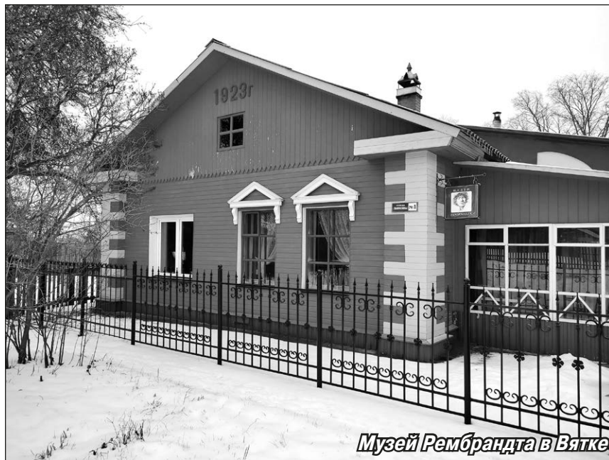
Музей Рембрандта в Вятке

В 2023 году мы отмечали десятилетие музея, и тогда состоялся первый показ копии четырёхметровой картины «Ночной дозор». Под таким названием известна знаменитая