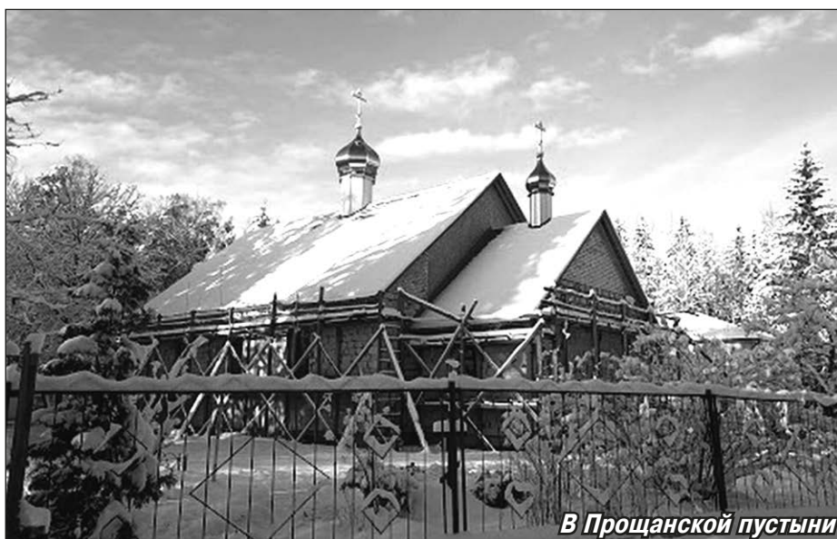
В Прощанской пустыни

Неудивительно, что преподобный Елисей выбрал это место: здесь всё располагает к тому, чтобы пребывать в гармонии с Творцом и природой. Рядом Налибокская пуца, откуда иногда без боязни приходят дикие животные. Их мы не видели, но по лесным тропинкам прогулялись. А ещё мы побывали на Аллее православных святых. По проекту возрождения Свято-Елисеевского Лавришевского