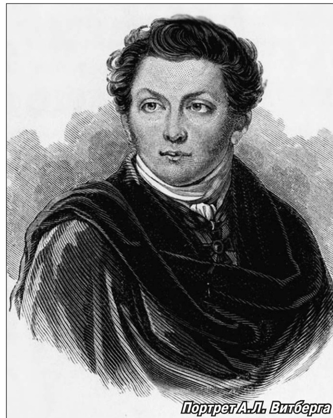
Портрет А.Л. Витберга