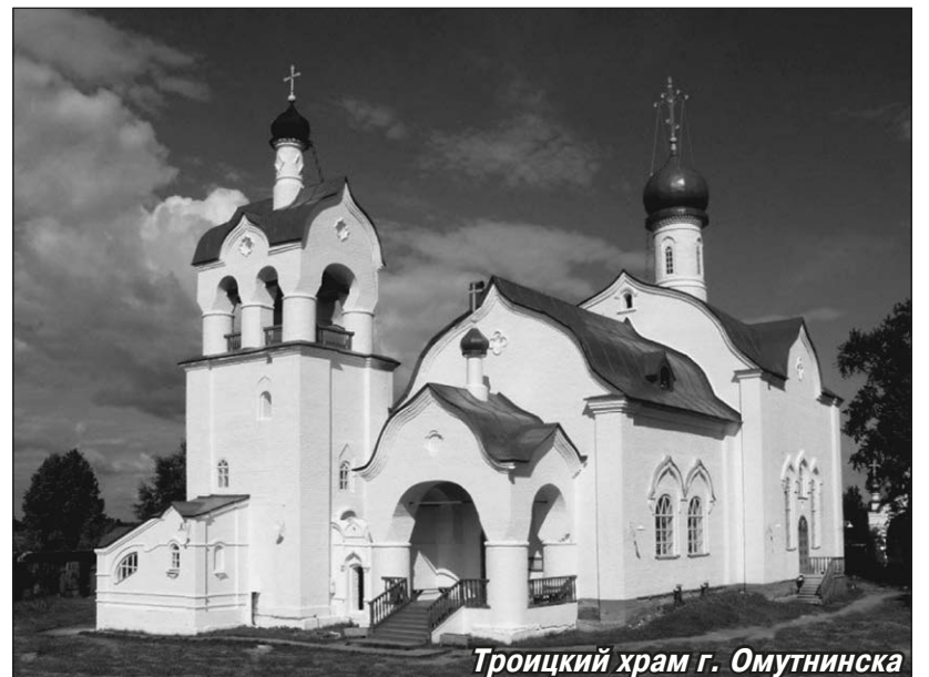
Троицкий храм г. Омутнинска