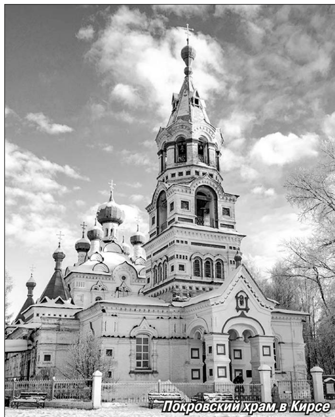
Покровский храм в Кирсе