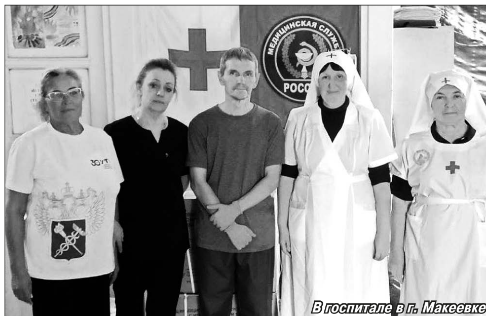
В госпитале в г. Макеевке