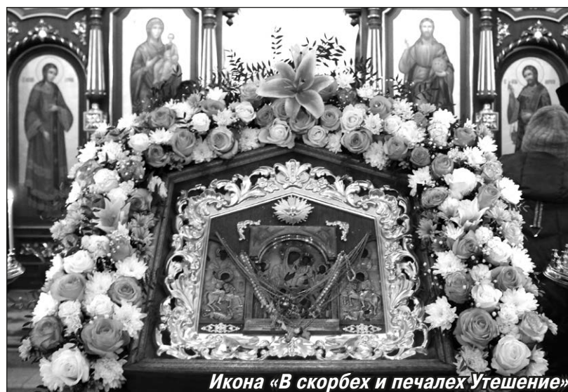
Икона «В скорбех и печалех Утешение»

Кроме того, до революции в монастыре хранился афонский образ Божией Матери «Скоропослушница», но он был утрачен. Для