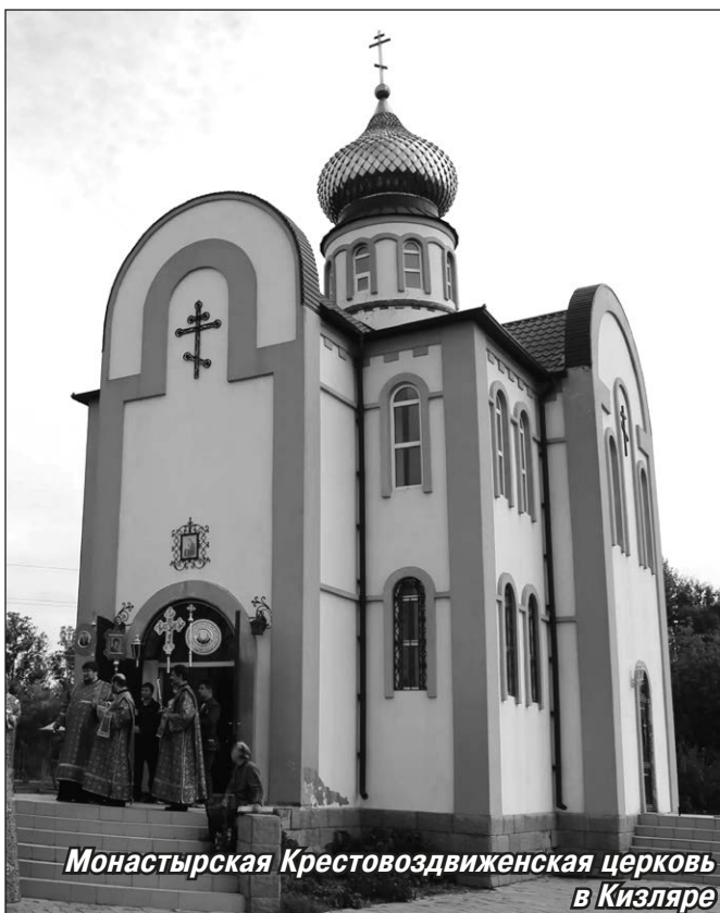
Монастырская Крестовоздвиженская церковь в Кизляре

Кизляр, куда мы ехали, находится в северо-восточной равнинной части Дагестана, в низовьях Терека. Этот город иногда называют северной столицей республики. Считается, что основан он в 1735 году, когда на этом месте была заложена русская крепость. Известно, что через эти места в далёкие времена пролегал оживлённый торговый путь из Европы на Восток. В знаменитом Каталонском атласе Авраама Крескеса, составленном в XIV веке, упоминалось торговое поселение Абсияхкент, вблизи которого впоследствии и была заложена крепость Кизляр. Поселение стало центром Терско-Кизлярского казачьего войска. Значение города как крупного транзитного и торгового центра постепенно возрастало. Помимо