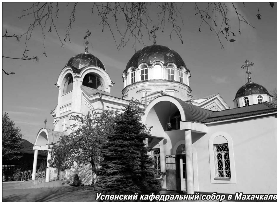
Успенский кафедральный собор в Махачкале