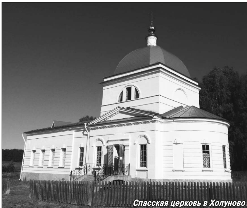
Спасская церковь в Холуново

— У монастыря имеется подворье в небольшом селе Холуново. Кто трудится