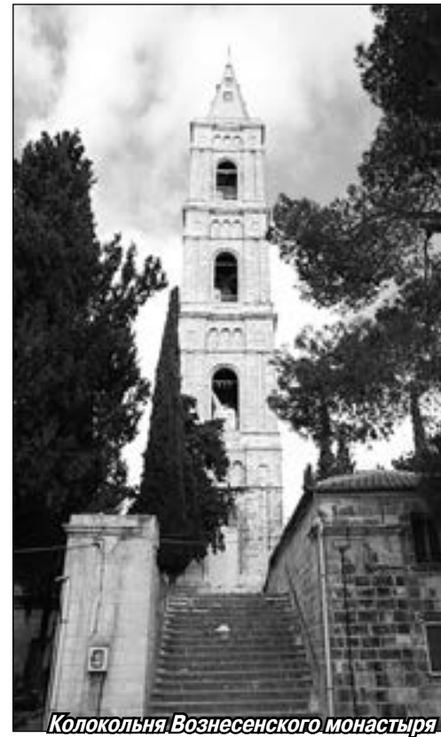
Колокольня Вознесенского монастыря

Архимандрит Антонин (Капустин) возглавлял Русскую духовную миссию в Палестине с 1865 до своей смерти в 1894 году. Им были приобретены многочисленные земельные участки на Святой Земле, связанные с важнейшими событиями Священной истории, построены многие храмы, паломнические приюты и школы для местного арабского населения. Благодаря усилиям этого человека на самой вершине Елеонской горы, в двухстах метрах от места Вознесения Христа, был также приобретён участок земли. Отец Антонин провёл на территории