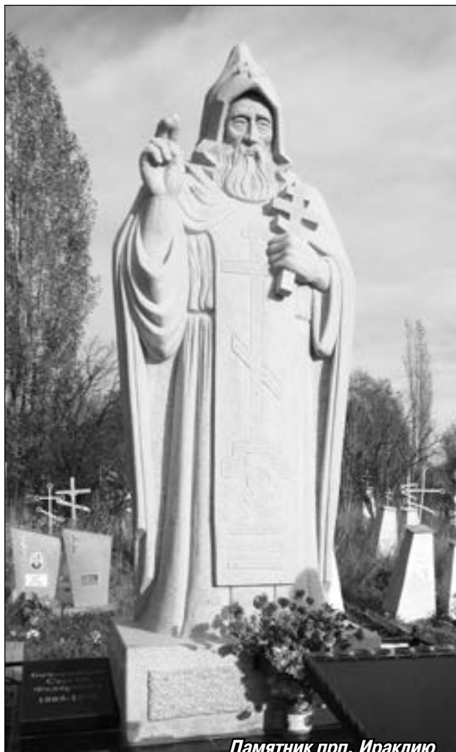
Памятник прп. Ираклию

Родился он в 1863 году в Черниговской губернии в семье казака по фамилии Матях и в миру носил имя Сергей. В монастырь его отдали ещё ребёнком, и родителей своих он не помнил. 25 марта 1905 года был пострижен в мона-