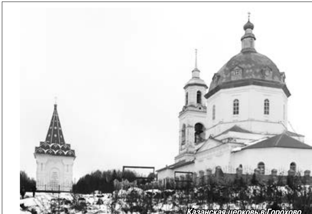
Казанская церковь в Горохово