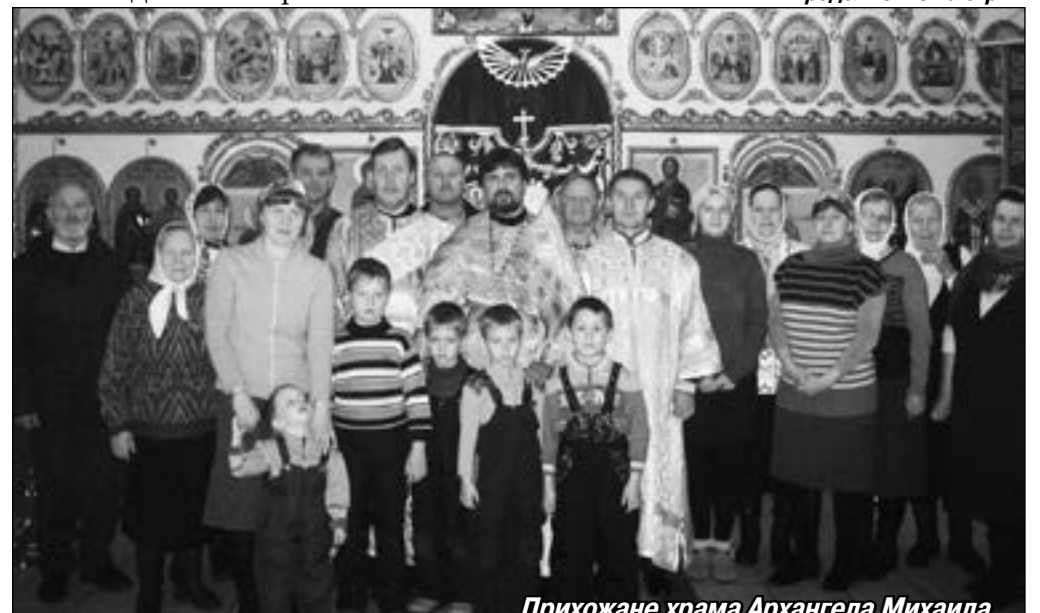
Прихожане храма Архангела Михаила

Летом деревянный дом обложили кирпичом и соединили с