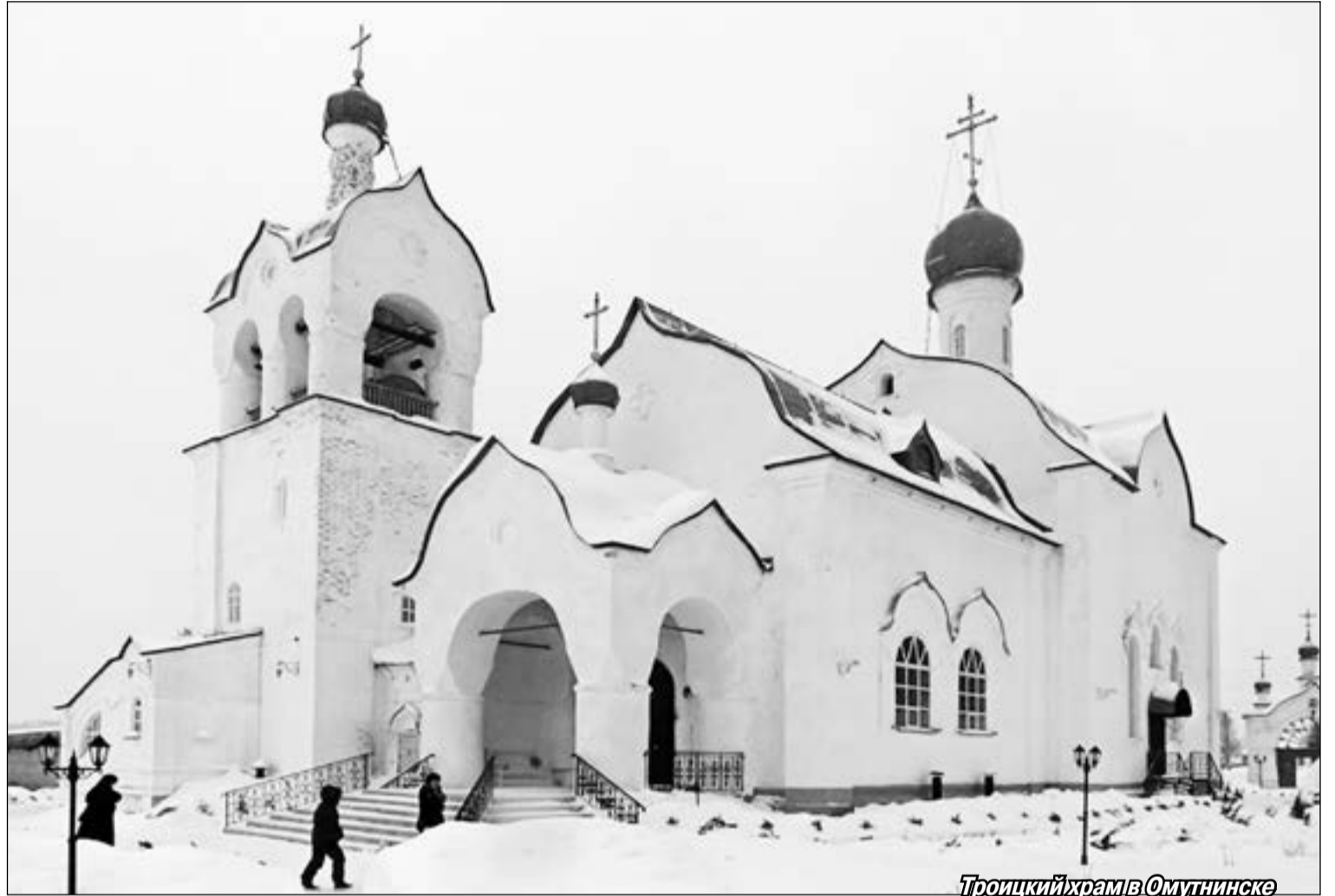
Троицкий храм в Омутнинске

весенней капели, от одного звука которой оттаивают промороженные житейской стужей души. А люди не расходятся, откликаясь на только что звучавшее под этими сводами: «Что такое прощение? Это аромат, который дарит цветок, когда его топчут», — и через паузу, не пустую, а насыщенную ожиданием новых слов: «Телевизору пять часов, а Господу — пять минут? А если Он скажет: «Тогда