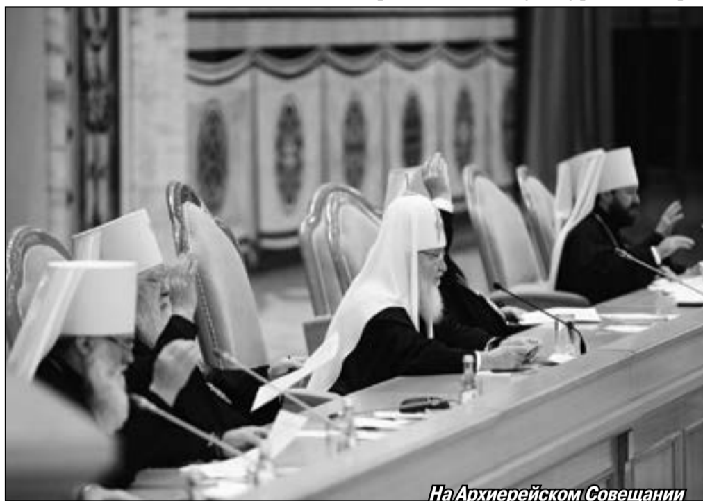
На Архиерейском Совеещании

не знает, как к храму приблизиться, очень сегодня нужна каждой приходской общине. Церковь неотделима от общества. Церковь и общество составляют в большинстве стран нашего канонического пространства одни и те же люди. Об этом нужно помнить сегодня всякому православному христианину. Церковь — это ни в коем случае не гетто, это не нечто отвлечённое, что всегда вступает с обществом в какие-то отношения напряжённого диалога. Это при всех сложностях, связанных с наличием в обществе