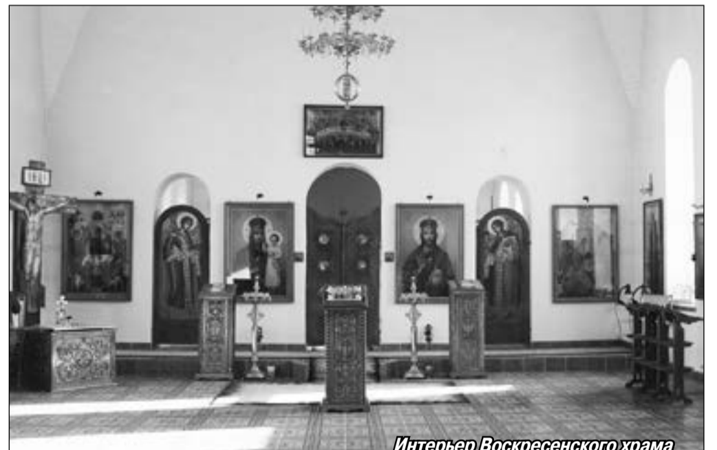
Интерьер Воскресенского храма

А пришло ли понимание, что исповедоваться, душу распахивать лучше батюшке, а не перед друзьями, которые и сами не знают, какие они друзья, а зато ведают, что враги они хорошие? Вполне