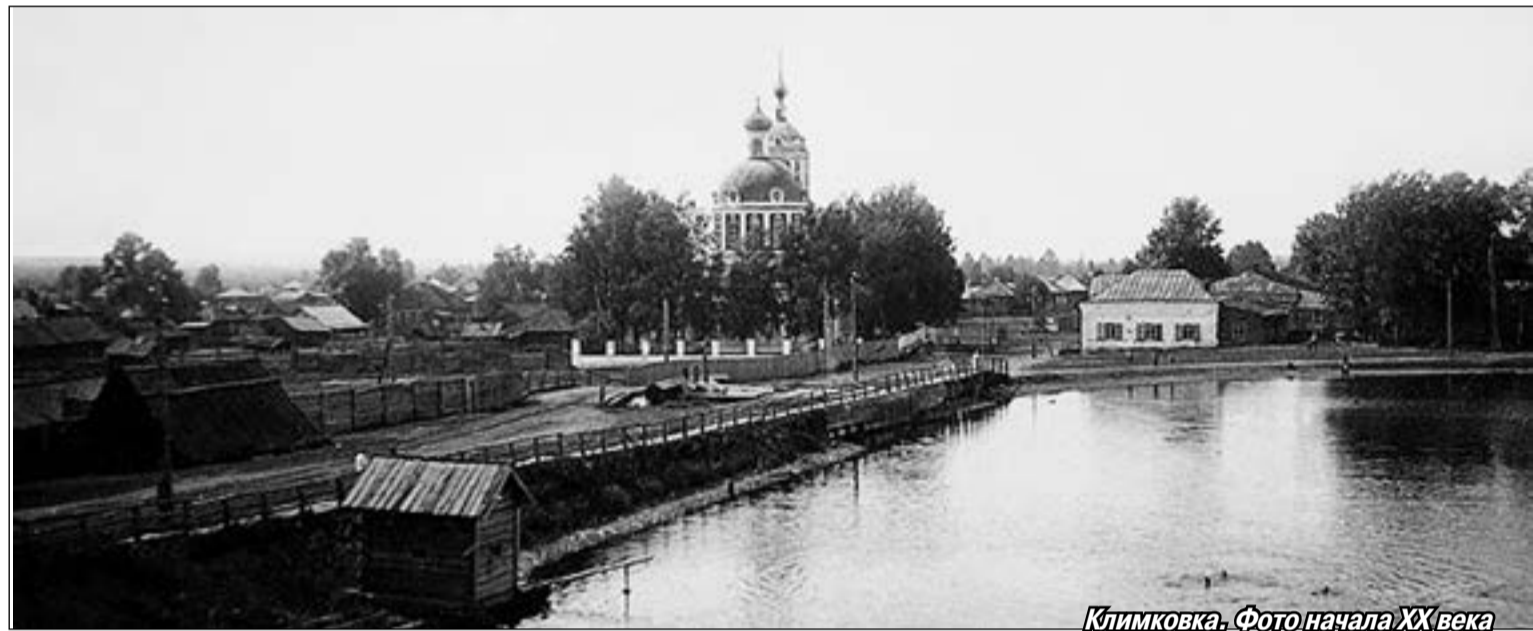
Климковка. Фото начала XX века

моленный этот воздух, коснуться мраморной плиты, и здесь тебе Иерусалим и Афон, Дивеево и Оптина пустынь. Лестница, ведущая вниз, возносит на небывалую прежде высоту, недавно принижённый, ты будто возрастаешь над собой прежним. Камень, упавший к ногам вятской паломницы в кувуклии Гроба Господня в Иерусалиме и привезённый в Омутнинск, не на виду лежит, а вделан, как в мощевик, в небольшую, похожую на уменьшенную копию Вифлеемской звезды серебристую формоч-