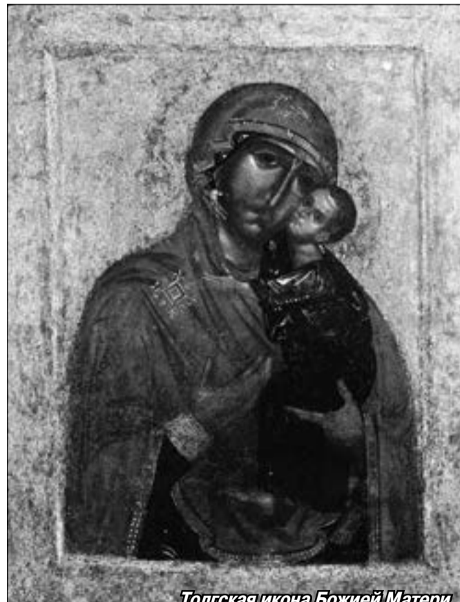
Толгская икона Божией Матери

Утром же спутники святителя заметили странное исчезновение посоха, который с вечера был поставлен у изголовья ложа архипастыря, и доложили Владыке. Тогда епископ со слезами рассказал о своей ночной молитве и повелел искать посох на другом берегу. Переплыв Волгу, слуги не только обнаружили жезл, но и обрели икону Пресвятой Богородицы, стоящую уже не в воздухе, а на земле. Тогда же, 8/21 августа 1314 года, решили основать на этом месте муж-