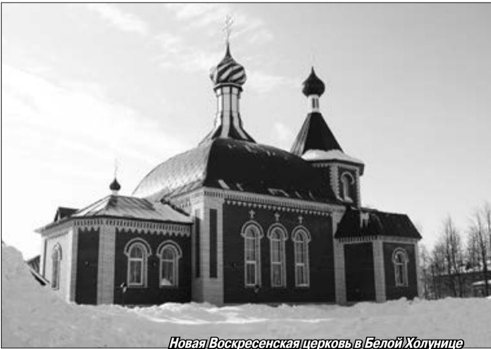
Новая Воскресенская церковь в Белой Холунице